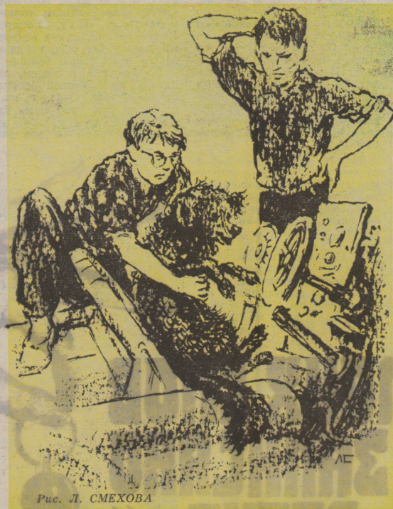
Рис. Л. СМЕХОВА

порядился покрасить дюз. Огромная, похожая на раструб старого граммофона, она почти на полметра выступала из кормы. Её мы покрасили чёрным лаком, хотя лак всё равно должен стёреть, когда начнёт работать двигатель и дюза раскисается.